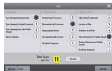
GCS Escala de coma de Glasgow. Registra el nivel de conciencia de los pacientes, para las evaluaciones iniciales.