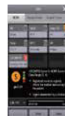
EWS Ayuda a reconocer a los pacientes cuyas condiciones fisiológicas están en riesgo de deterioro.