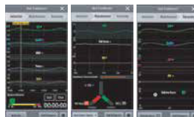
BoA Dashboard™ Ayuda a lograr una anestesia óptima durante todo el periodo operativo.