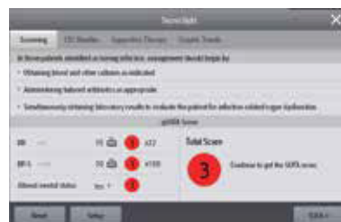
SepsisSight™ Proporciona una lista de verificación para ayudar a los profesionales sanitarios a detectar, diagnosticar y tratar a pacientes sépticos de acuerdo con las directrices de la SSC.