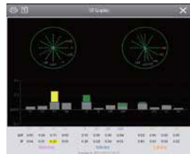
ST Graphic™ Ayuda a los profesionales sanitarios a evaluar rápidamente las elevaciones y depresiones del segmento ST.