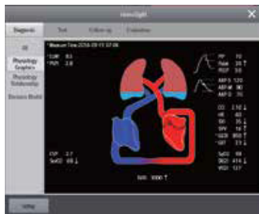
HemoSight™ Ayuda a los profesionales sanitarios a tomar decisiones a través de un conjunto de aplicaciones de asistencia hemodinámica.

La serie BeneVision N ofrece potentes aplicaciones clínicas asistenciales (CAAs) para apoyar la toma de decisiones eficientes cuando el tiempo es crítico. Cada CAA se centra en los principales desafíos del flujo de trabajo clínico a los que se enfrentan los diferentes departamentos individuales.